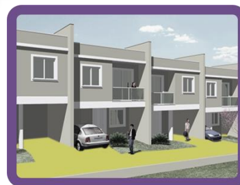
Pisos em condomínios