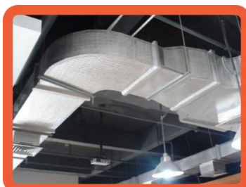
Dutos de ar condicionado