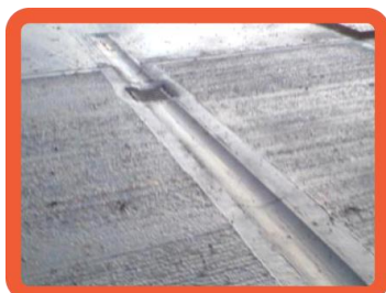
Canaletas de concreto