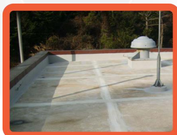
Lajes de concreto