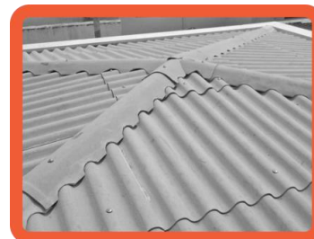
Telhas de fibrocimento (amianto)